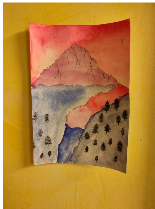
(Eloan – Le flot des différents aspects de l'amour)

Les enfants ont également fait un petit arrêt par la planète Épicerie. Ils ont dévalisé les stocks de bonbons, chips et boissons de la planète. Nous avons tout de même remarqué que la seule habitante de la planète (la vendeuse) a plus souvent souri que lors des années précédentes !