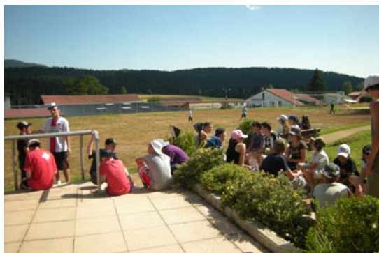
Après-midi sportive au Stade de la Côte-aux-fées