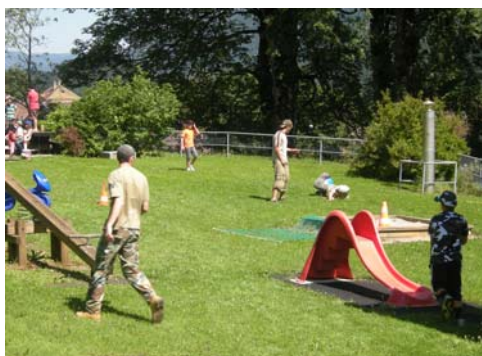
Dissensions au sein des forces de l'ordre