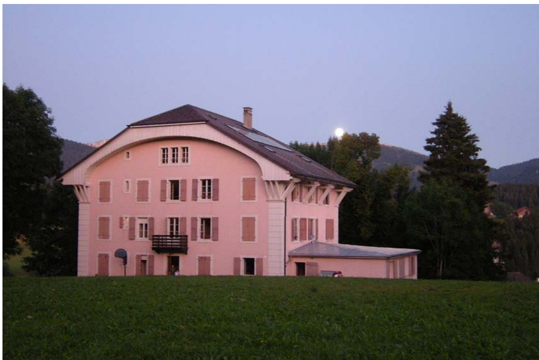
Le départ s'empare de la colo tandis que les ténèbres sont éclairées d'une simple lune...