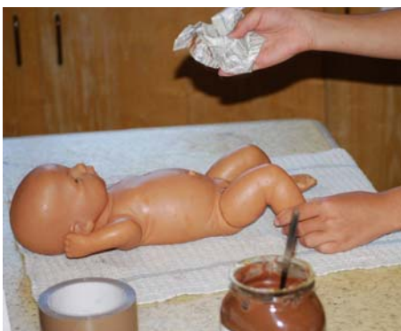
Baby-boom au Val-de-Travers