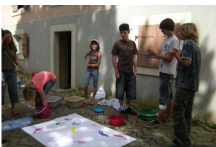
Exposition : quand les arts s'invitent à la Colo, y a pas d'léopard