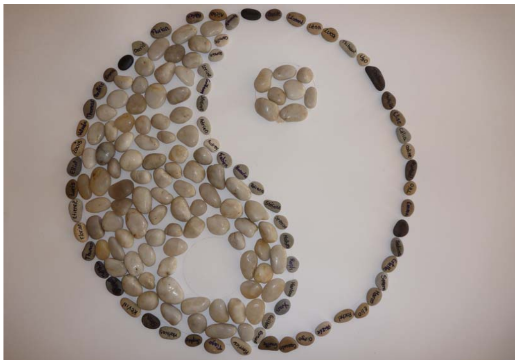
Tel un ouragan, un vent de Joie-de-Vivre s'est abattu sur la Colo.