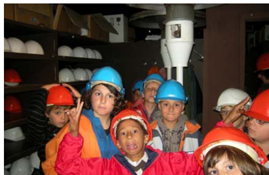
Visites à faire dans la région jurassienne : carnet de route