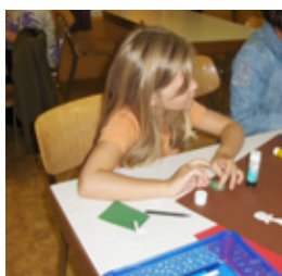
Les colliers égyptiens