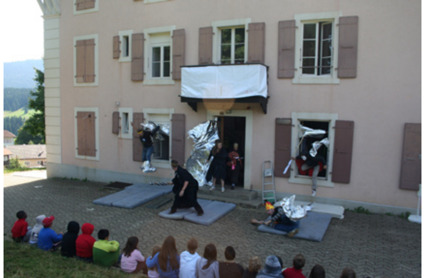
Le passage dans un vortex temporel semble très douloureux

Lors d'une journée comme les autres, un portail temporel s'est ouvert sur notre petite maison. De ce dernier sont sortis trois rois, frères qui plus est. Apparemment ils étaient en train de se battre pour savoir lequel aurait le droit de gouverner le château de la Côte-aux-Fées. Etant donné que leurs armées sont restées en 1508, ils ont demandé aux enfants de faire partie de leur armée personnelle.