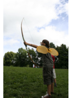
Les enfants, sans le savoir, ont réalisés à leur tour les méfaits de Loki