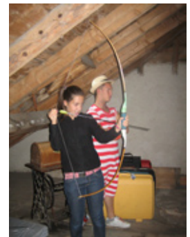
Crever des ballons avec un arc? Un jeu d'enfants!

Les colons ont donc eu droit à des postes leur permettant de mettre à profit leurs talents de danseurs, de potiers, de percussionnistes, d'équilibristes (qui a dit que porter une jarre d'eau sur la tête était facile).