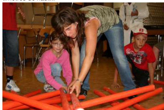
Travailler en équipe est primordial quand les bâtons de mikado font 2 mètres de long!