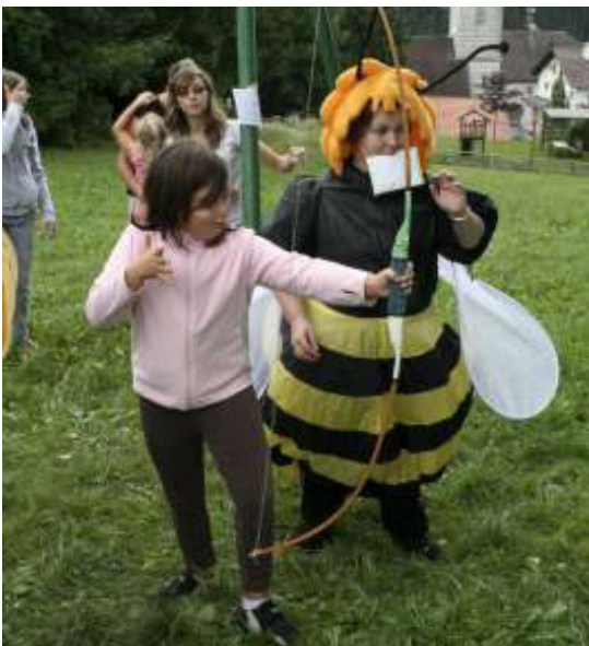
Il n'y a qu'un dieu maléfique pour avoir de telles idées