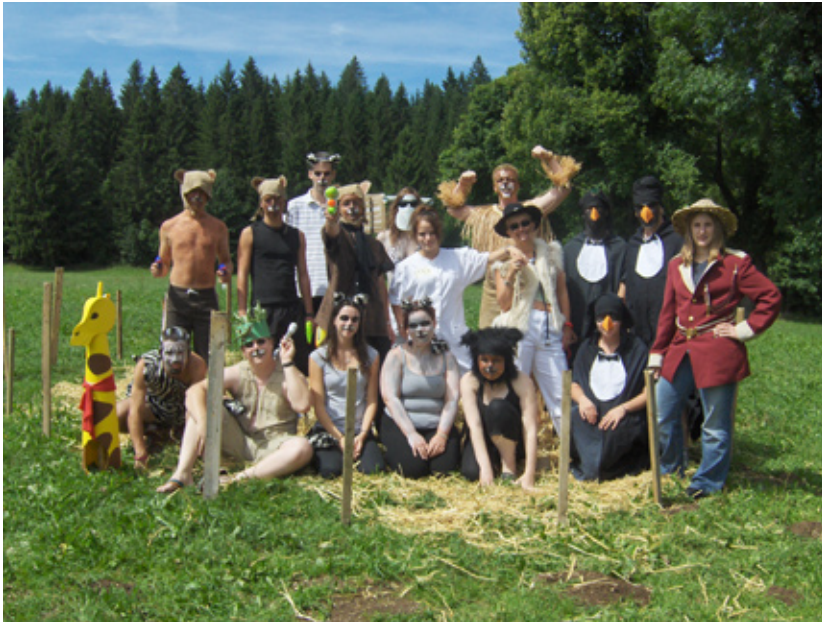
Promis, ils ne mordent pas. Enfin pas tous...

Journal de la colonie la Joie de Vivre - Camp C 2008