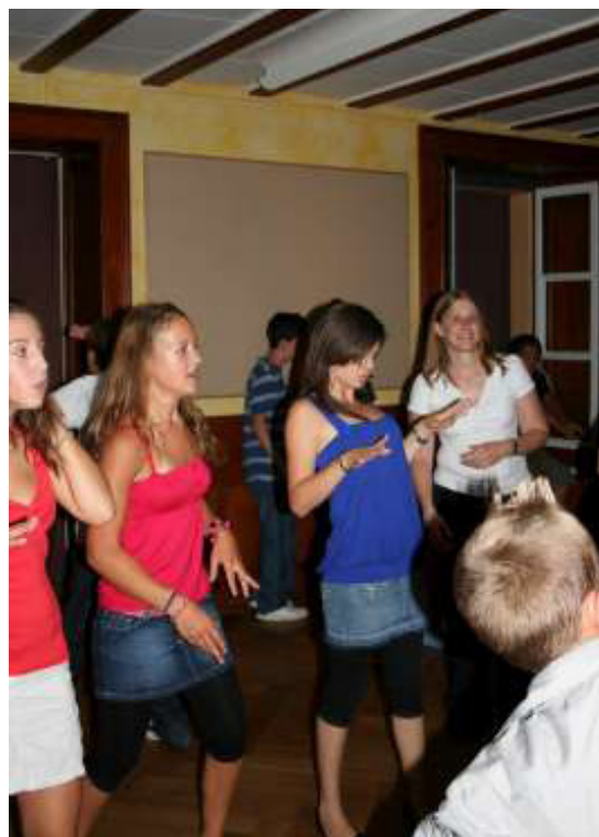
La chorégraphie de Titou le lapinou met le feu à la colo.