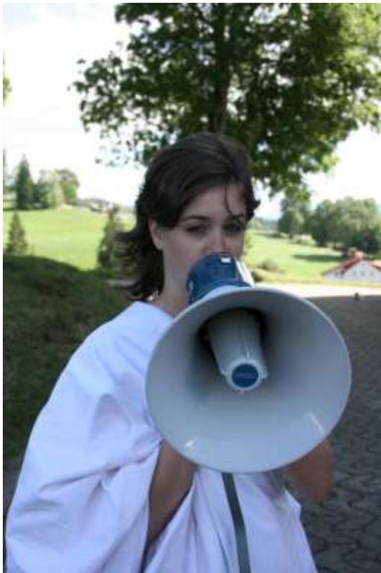
Dieu faisant gronder sa puissante voix