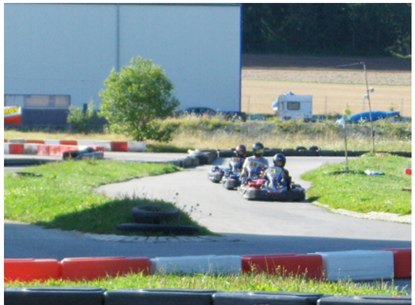
En récompense pour leur super journée, les ados ont pu aller faire du kart!