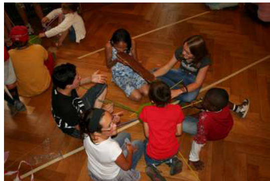
Pas facile de manger une tartine quand on on fait 2 centimètres de haut...

professeur a réussi à réparer sa machine et à nous faire rétrécir... un peu trop d'ailleurs. Et les enfants se retrouvèrent de la taille d'une poupée Barbie. Ils se sont donc adaptés, en participant à différents jeux, tels que le baby-foot géant, le Pictionary en regardant depuis le 2ème étage, ou encore le mikado géant.