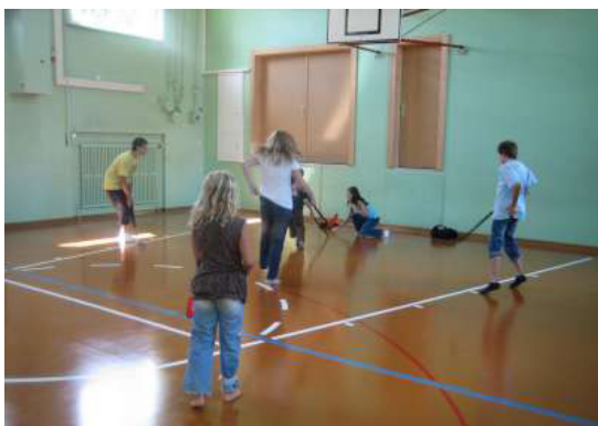
Un match de hockey intense