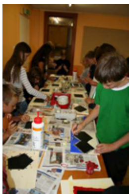
Un groupe en pleine création de tableaux noirs

Tableaux noirs, bouteilles de sable coloré, bracelets brésiliens, pochettes-doudous, colliers égyptiens, apprentissage de la langue des signes, voici quelques ateliers qui ont été proposés à vos enfants.