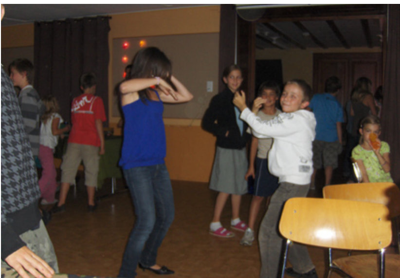
Pour ceux qui ont perdus toutes leurs capsules, la monnaie du casino, la banque donne des gages comme de faire une chorégraphie ou boire des mélanges peu ragoutants

De plus, un immense banquet leur était proposé, de manière à remplir leur estomac afamé, après leur bataille de l'après-midi.