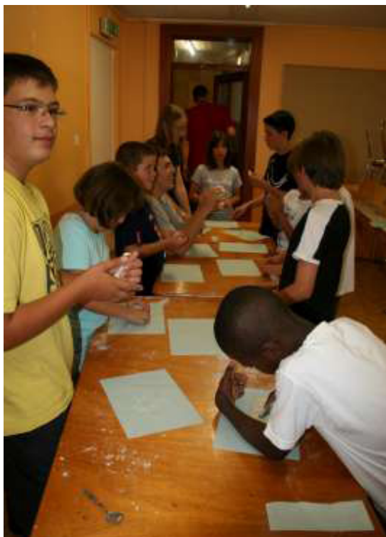
Un groupe en pleine création d'objets en pâte à sel