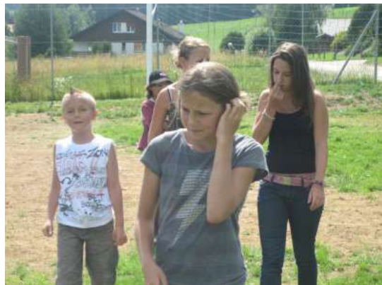
Aaaaah le complexe problème de la balle brûlée...