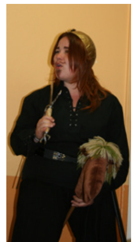
En haut à gauche, un groupe de vampire prêt à faire peur!