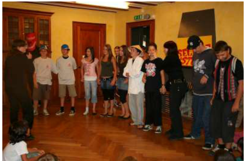
Tous les personnages de Secrer colo Story, interprétés par les ados

Pour cette après-midi, les ados du camp ont transformé la colo en plateau de « secret story ». La maison est donc très vite remplie de personnes aux secrets plus impressionnants les uns que les autres. Mais un secret n'a pas été révélé. Et les enfants, accompagnés des monos (qui étaient considérés comme des enfants), ont dû réaliser un certain nombre de poste, de manière à obtenir les indices leurs permettant de connaître ce terrible secret. Vous souhaitez le connaître? Dans ce cas, il faudra le demander à vos enfants