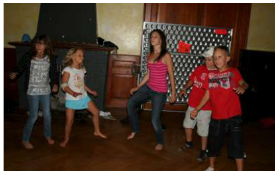
Et vive la danse africaine!