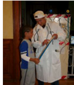
Le professeur avant...

Ce matin, après le traditionnel exercice incendie, un drôle de savant a tenu à nous faire la démonstration de sa machine à agrandir et rétrécir les gens. Il prétendait que les personnes qui rentreraient dedans, pourraient changer de taille. La science étant ce qu'elle est, la machine a décidé de n'en faire qu'à sa tête, et a agrandi tous les enfants et cadres de la colo. Le professeur n'étant pas certain de pouvoir réparer sa machine, les enfants ont dû s'entraîner à vivre avec leur grande taille, en participant à des jeux, dont les objets avaient gardé leurs taille normale, ce qui a été assez facile pour eux. Cependant, ils ont dû affronter un problème bien plus grave, la taille ridicule des raquettes de ping-pong, ainsi que celles... de leurs assiettes. Heureusement le