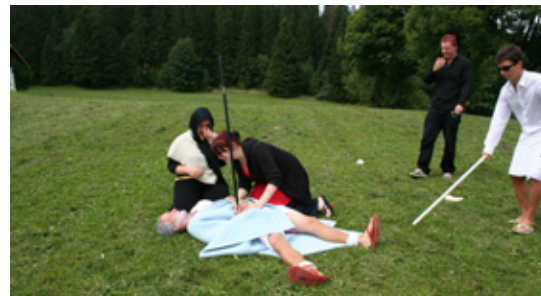
Une mauvaise plaisanterie de Loki a coûté la vie au dieu Baldr