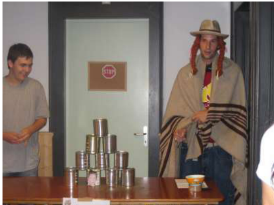
Qui parviendra à faire tomber toutes les boîtes du jeu de massacre?