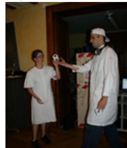
...et après le passage dans la machine

professeur a réussi à réparer sa machine et à nous faire rétrécir... un peu trop d'ailleurs. Et les enfants se retrouvèrent de la taille d'une poupée Barbie. Ils se sont donc adaptés, en participant à différents jeux, tels que le baby-foot géant, le Pictionary en regardant depuis le 2ème étage, ou encore le mikado géant.