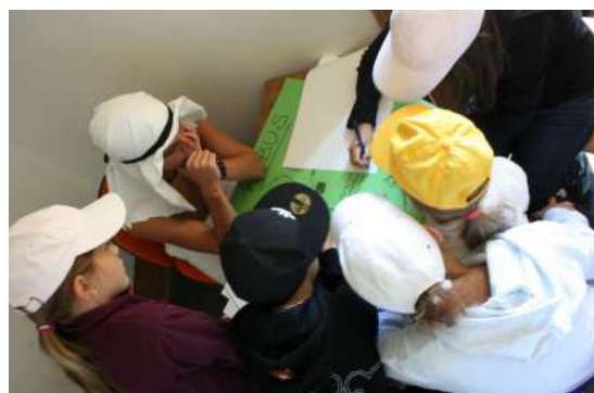
Les rébus des Egyptiens sont réputés pour être très difficiles

Eh oui, c'était inévitable ! A force de voir les populations de la terre se bagarrer pour savoir laquelle est la plus forte, Dieu en a eu marre, et a décidé d'éteindre la flamme olympique, tant que les populations terriennes n'auront pas réglé cet épineux problème lors de défis réalisés dans les « règles de l'art » et avec fair-play. Les enfants, divisés en plusieurs civilisations, se sont alors affrontés lors de jeux de réflexion, ainsi que pendant des épreuves physiques. Je vous rassure, ils sont à nouveau tous devenus amis, lors de la boum du soir proposée par Dieu.