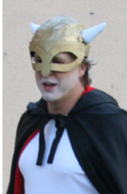
Loki et Odin face à face