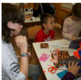
La réalisation de pochettes